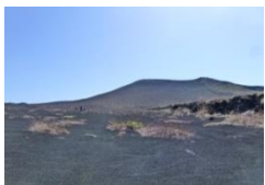
三原山裏砂漠(ハイキングOP)