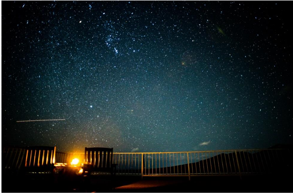
三原山テラス(大島) K.T様