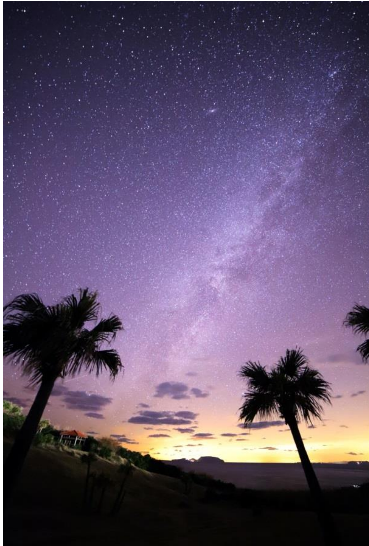
伊豆諸島と天の川(三宅島) F.Y様