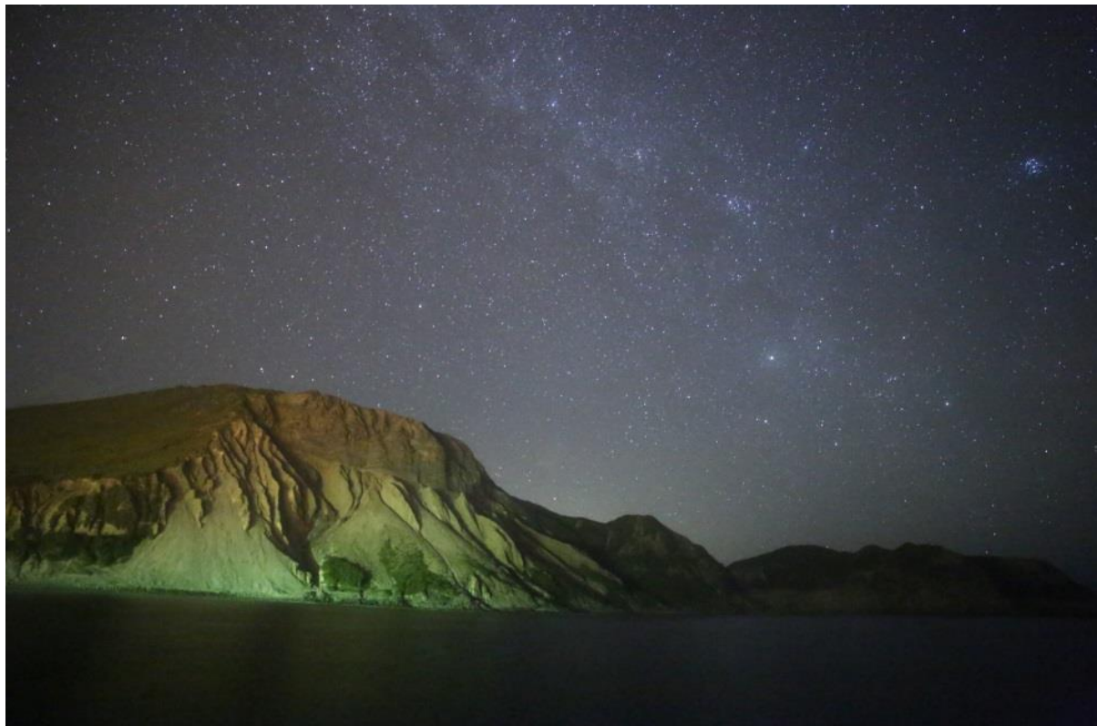
多幸湾から見た天上山と星空(神津島) T.F様