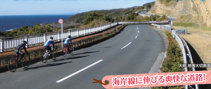
大島 地層大切断面