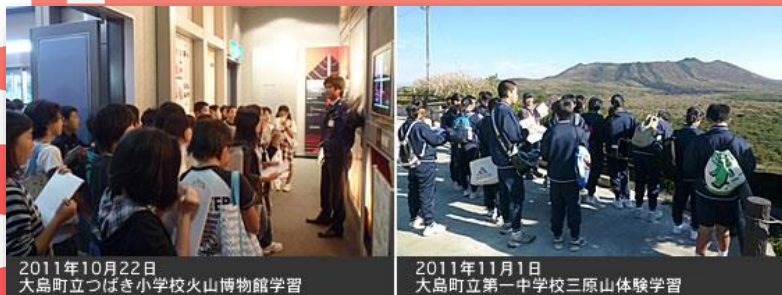
2011年10月22日 大島町立つばき小学校火山博物館学習