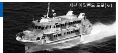
세븐 아일랜드 도모(友)

물속에는 항공기와 같은 날개가 있습니다. 선체가 안정되도록 컴퓨터 자동제어장치로 항상 조정하고 있어 거친 바다를 시속 약 80km로 질주해도 상하 또는 좌우로 흔들리지 않습니다!