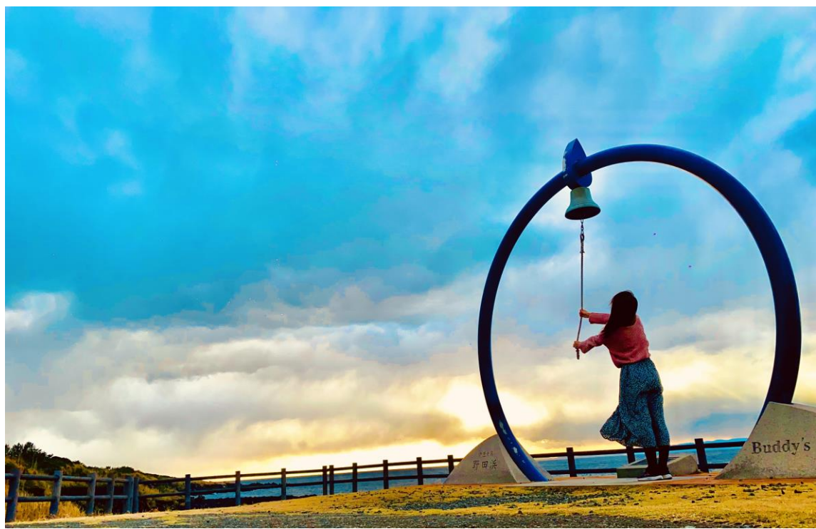
入選「神様が叶えてくれる！」 AIKAさま