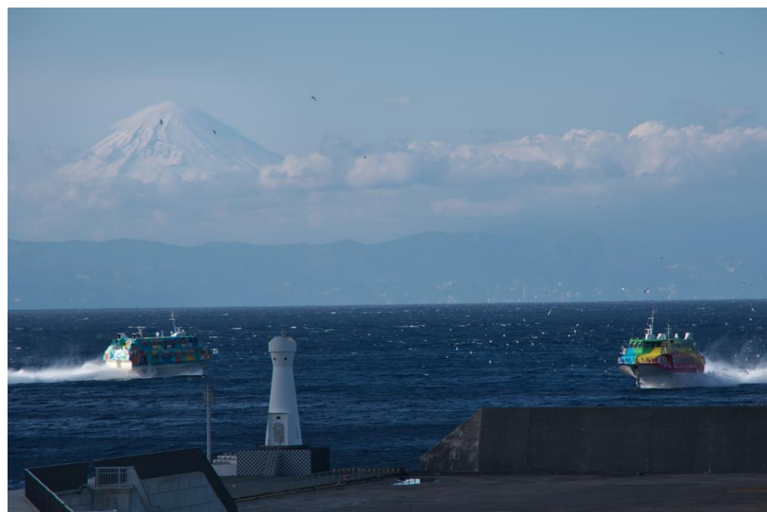
入選「ジェット船走る-岡田港にて」 霜山 一平さま