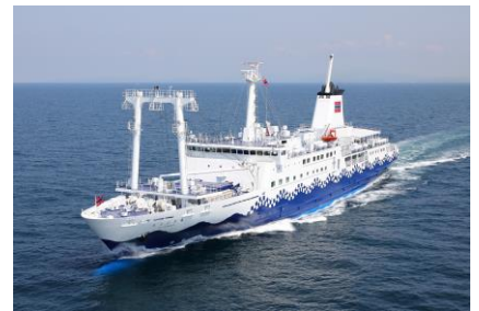
2020年6月25日就航 新造船さるびあ丸