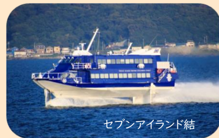
セブンアイランド結

8:35頃東京・竹芝桟橋～(高速ジェット船)～10:40頃大島 == ぶらっとハウス(農産物直売所でお買い物! ソフトクリームもおすすめ♪) == 御神火スカイライン<車窓見学> == 三原山頂口(大島のシンボル三原山を見学) == 大島温泉ホテル・昼食(島の食材を使った「島っこ膳」をお楽しみください) == スーパーげんろく(地元の方も利用するスーパーでお買い物!) 14:35頃大島～(高速ジェット船)～16:40頃東京・竹芝桟橋