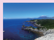
【式根島】神引眺望台