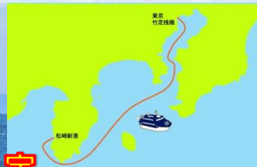
東海汽船のセブンアイランド (写真はイメージです)