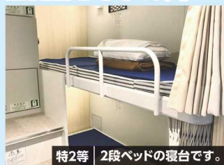
特2等 2段ベッドの寝台です。

おひとり様につき 1,000円増 で往路の船室を 1等にランクアップ することができます*子どもは500円 出発日の前日までに申し込みください 1等 ※他のお客様と男女相部屋になります。