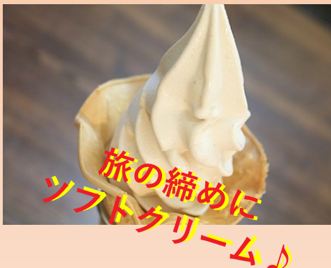
旅の締め ソフトクリーム♪