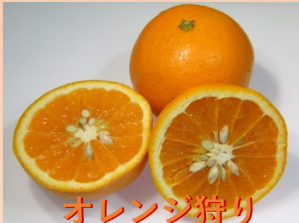
オレンジ狩り できます♪