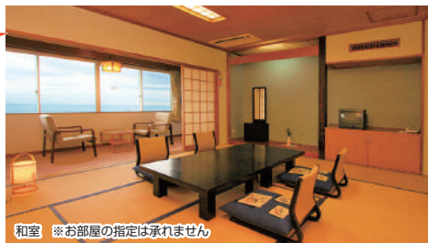
和室 ※お部屋の指定は承れません