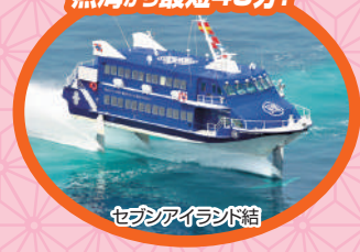
セパアイランド船