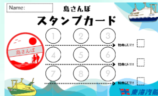
スタンプカードイメージ

※割引乗船券の特典の受取には「東海汽船アプリ」(無料)のダウンロードが必要です。