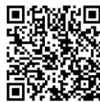
ツアーパンフレット