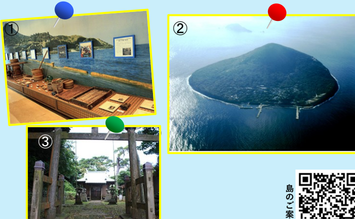
①利島村郷土資料館 ②利島(空撮) ③阿佐佐和気命神社