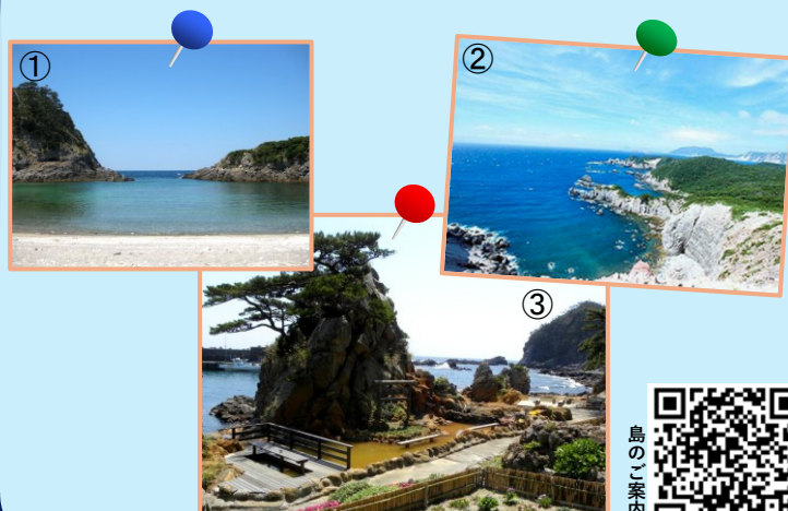
①泊海水浴場 ②神引展望台 ③松が下雅湯