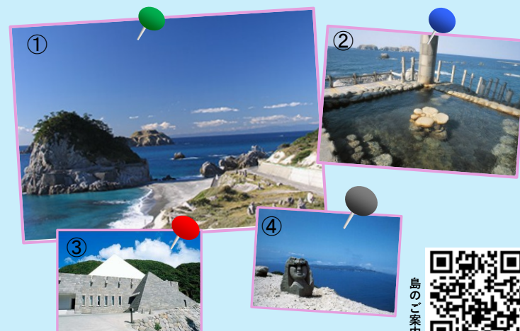
①間々下海岸 ②湯の浜露天温泉 ③新島村博物館 ④モヤイ像