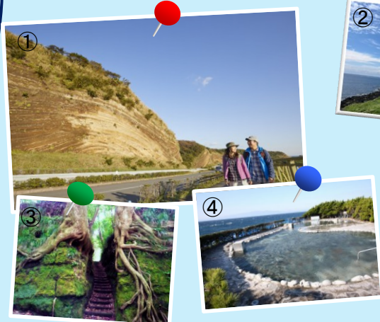
①地層大切断面 ②サンセットパームライン ③泉津の切通し ④浜の湯