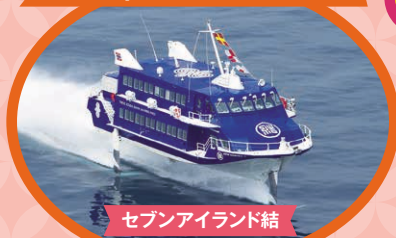
セブンアイランド結