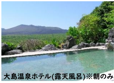
大島温泉ホテル(露天風呂)※朝のみ

昼食(三原山頂口 歌の茶屋) 店内の飲食メニューより お一人様1品 お選びいただけます。