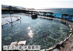
元町港の湯(水着着用)

プラス1,000円(子どもはプラス500円)で船室ランクアップオプションをご利用いただけます。