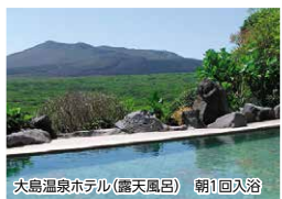
大島温泉ホテル(露天風呂) 朝1回入浴