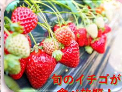
旬のイチゴが 食べ放題！