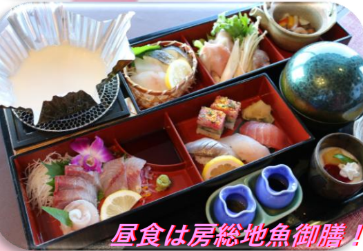
昼食は房総地魚御膳！