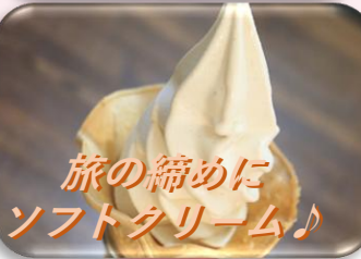
旅の締め ソフトクリーム♪