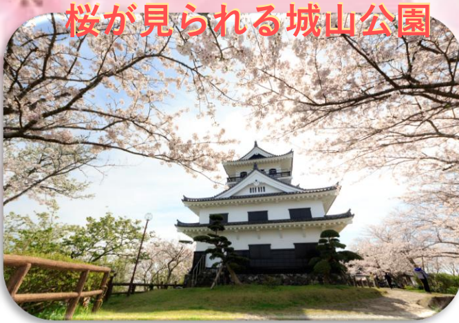
桜が見られる城山公園