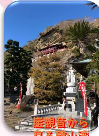
崖観音から 見る館山湾