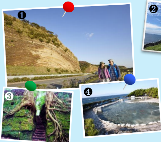
①地層大切断面 ②サンセットパームライン ③泉津の切通し ④浜の湯