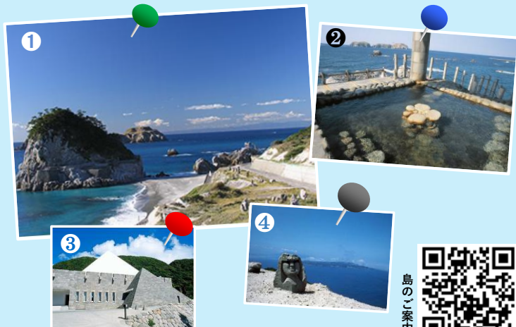
①間々下海岸 ②湯の浜露天温泉 ③新島村博物館 ④モアイ像