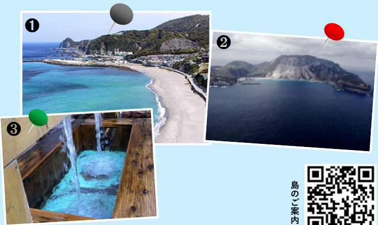
①前浜海水浴場 ②多幸湾(空撮) ③多幸湧水