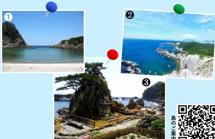
①泊海水浴場 ②神引展望台 ③松が下雅湯